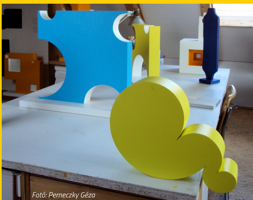
Fotó: Perneczky Géza